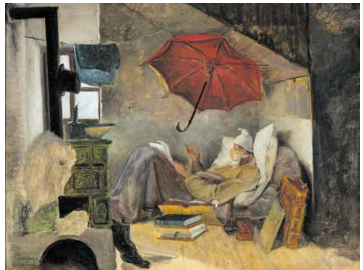
Carl Spitzweg, Der arme Poet, Entwurf, ca. 1837, Grohmann Museum, Milwaukee

Die Sammlung Georg Schäfer in Schweinfurt und das Kunsthaus Apolda zeigen eine umfang-