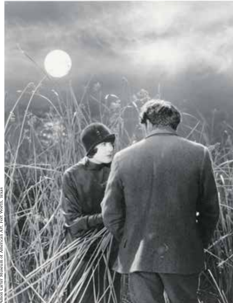
Karl Struss, Filmstill aus Sunrise mit Margaret Livingston und George O'Brien, 1927

Moving Pictures: Karl Struss and the Rise of Hollywood 12. Mai bis 25. August 2024 Amon Carter Museum of American Art, Fort Worth, TX Katalog zur Ausstellung Text: Englisch Hirmer Verlag € 49,90