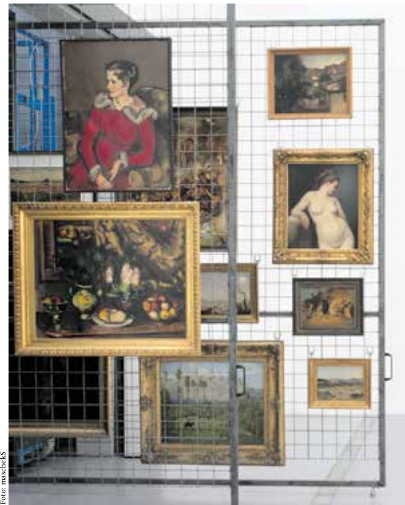
Reise der Bilder, Depot, Lentos Kunstmuseum Linz

individuell das Leid der Opfer, ihre Hilflosigkeit in einer maximalen Bösartigkeit bemühten Verwaltungsmaschinerie und gegenüber gierigen Nachbarn und einem skrupellosen Kunsthandel konkret werden zu lassen. Dass das Lentos Kunstmuseum in seiner ambivalenten Geschichte eine ganz besondere Kompetenz auch in Sachen Restitution entwickelt hat, macht das Studium dieser knapp gefassten Texte zusätzlich zu einer fesselnden Lektüre. mk