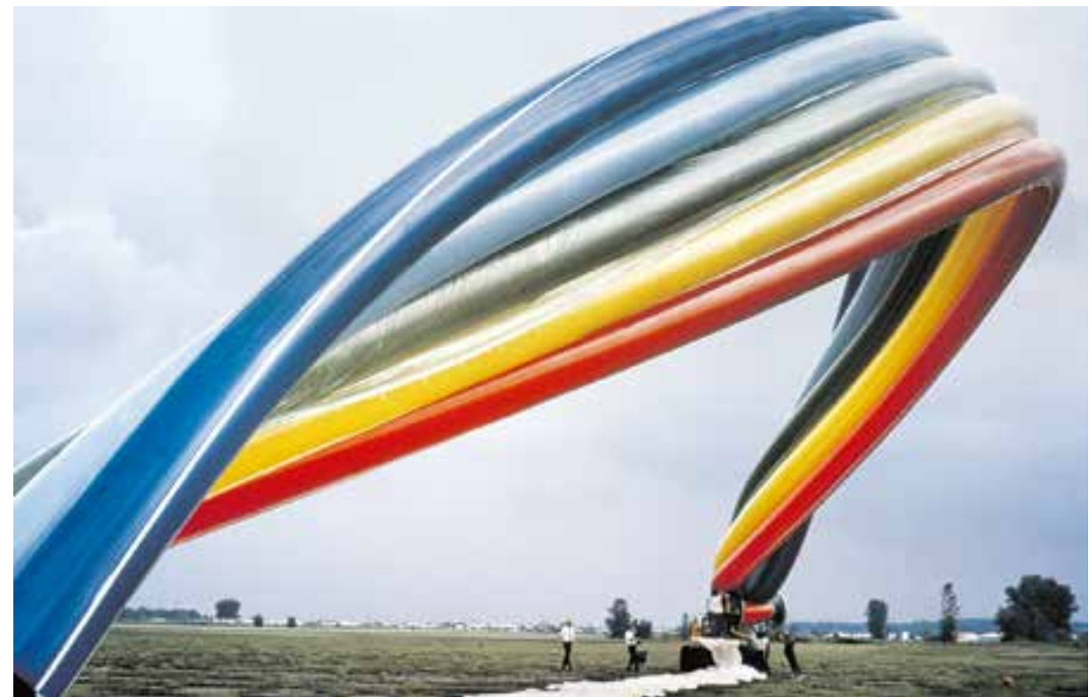
Otto Pieni, Testinstallation Olympischer Regenbogen , 1. August 1972, St. Paul, Minnesota, USA

Pieni wendet sich schon damals dem Phänomen des Lichtes in all seinen Erscheinungsformen zu. Zunächst dienen ihm Feuer und Ruß als Malmittel. Er bearbeitet grundierte Leinwände mit dem Bunsenbrenner, bis sich aus Blasen sogenannte Feuerblumen bilden, und zeichnet in seinen Rauchzeichnungen