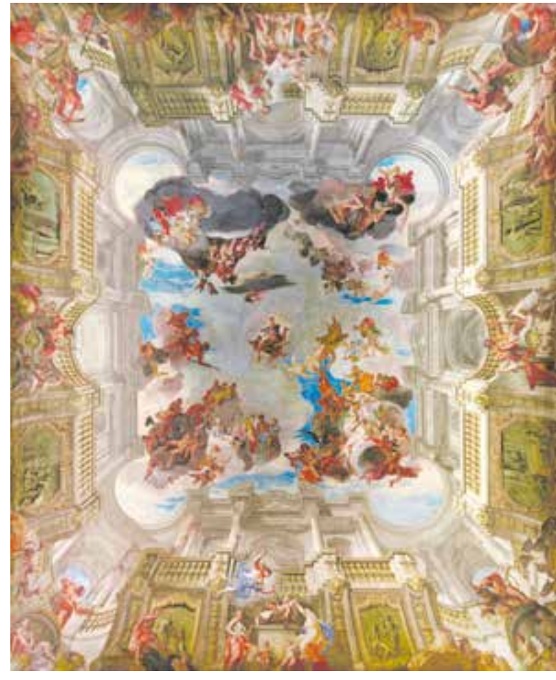
Andrea Pozzo, Apotheose des Herkules, 1704/1708, Deckenfresko im Herkulesaal des Gartenpalais Liechtenstein, Wien

Herkules der Künste Bis 1. April 2024 Gartenpalais Liechtenstein, Wien Katalog zur Ausstellung Hirmer Verlag € 38,-