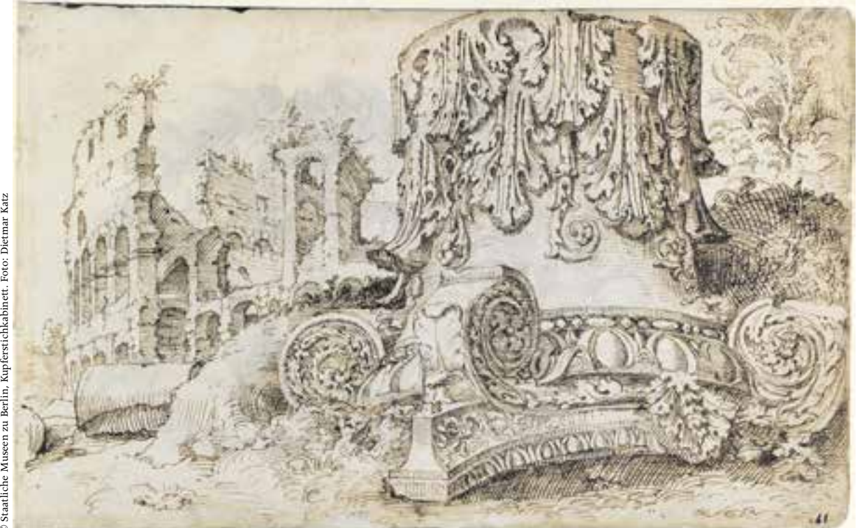
Maarten van Heemskerck, Kompositkapitell und Kolosseum, 1532–1536/37

der Basilika. Zur Ausstellung erscheint ein 352 Seiten starker Katalog (Hirmer Verlag € 145,-), der sämtliche Zeichnungen sowie Gemälde und Grafiken des Künstlers vorführt.