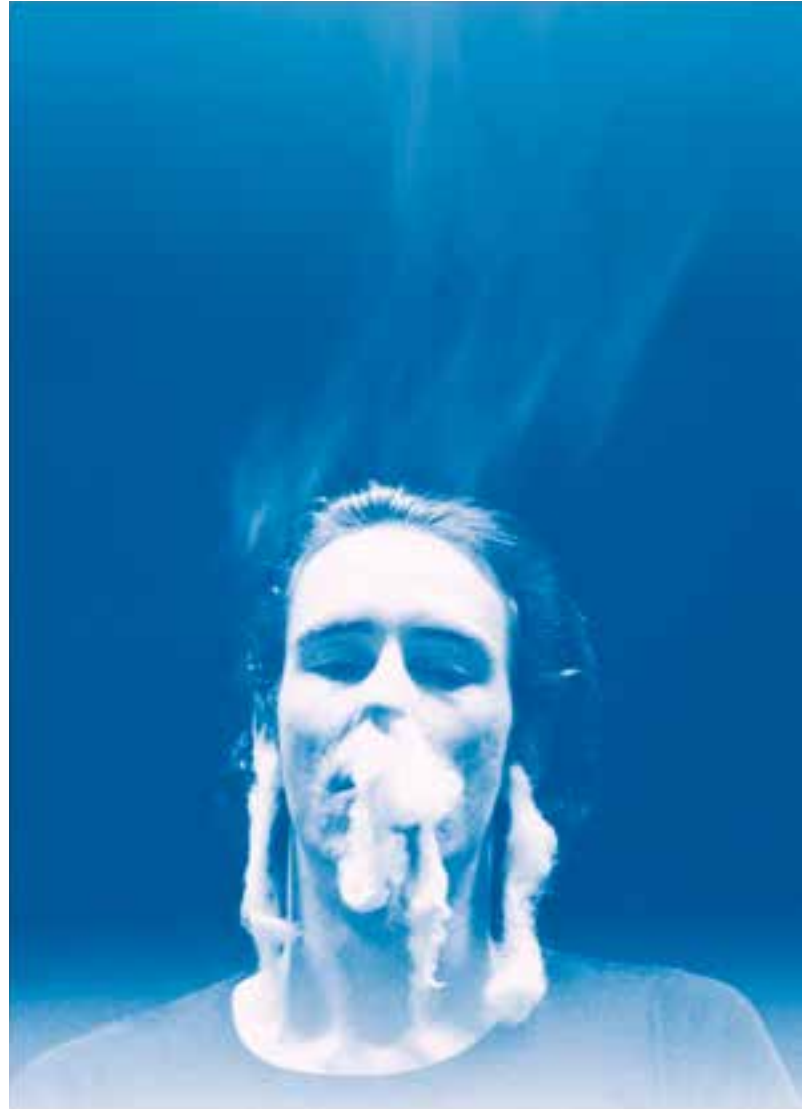
Mike Kelley, Ectoplasm Photograph 7, 1978/2009

Die mit Abstand bedeutendste Retrospektive im diesjährigen internationalen Kunstkalender dürfte Mike Kelley. Ghost and Spirit sein. Aktuell zeigt das K21 – Kunstsammlung Nordrhein-Westfalen in Düsseldorf die groß angelegte Museumsschau, die aus der Zusammenarbeit der Bourse de Commerce in Paris/ Sammlung Pinault, dem K 21, der Tate Modern, London, und dem Moderna Museet, Stockholm, entstanden ist. In Paris wurde die Ausstellung bereits im letzten Herbst gefeiert.