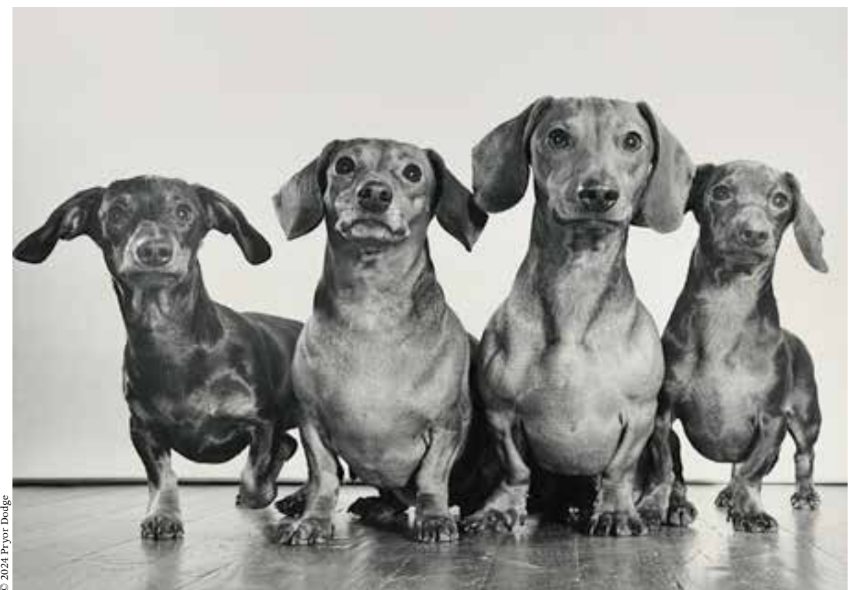
Ylla, Four dachshunds , ca. 1948, veröffentlicht in Dogs by Ylla , 1950

Von Miroslava Beham Camilla Kofler (1911–1988), besser bekannt als Ylla, galt zu Lebzeiten als beste Tierfotografin der Welt und Pionierin dieses Genres. So komplex ihre Herkunft war, so bewegt gestaltete sich auch ihr kurzes Leben, das sie bei einem Unfall verlor.