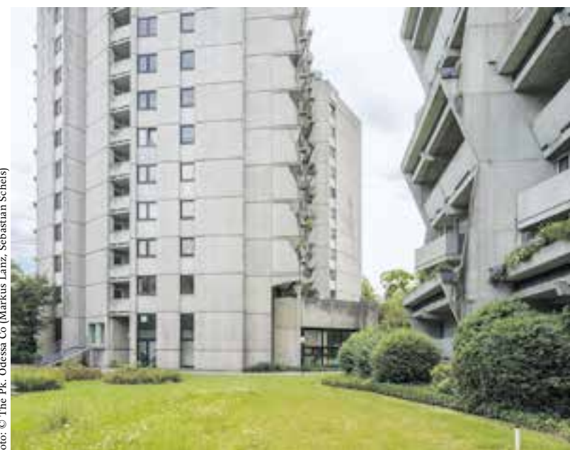
Orpheus & Eurydike , München, bezugsfertig 1973. Architekten: Jürgen Freiherr von Gagern, Udo von der Mühlen und Peter Ludwig

wie Amalienpassage, Kurfürstenthof, Max & Moritz oder Orpheus & Eurydike , die anhand von Fotografien und Plänen ausführlich deren Struktur und Nutzung vorstellen und zugleich Anregungen für den Wohnungsbau der Zukunft geben.