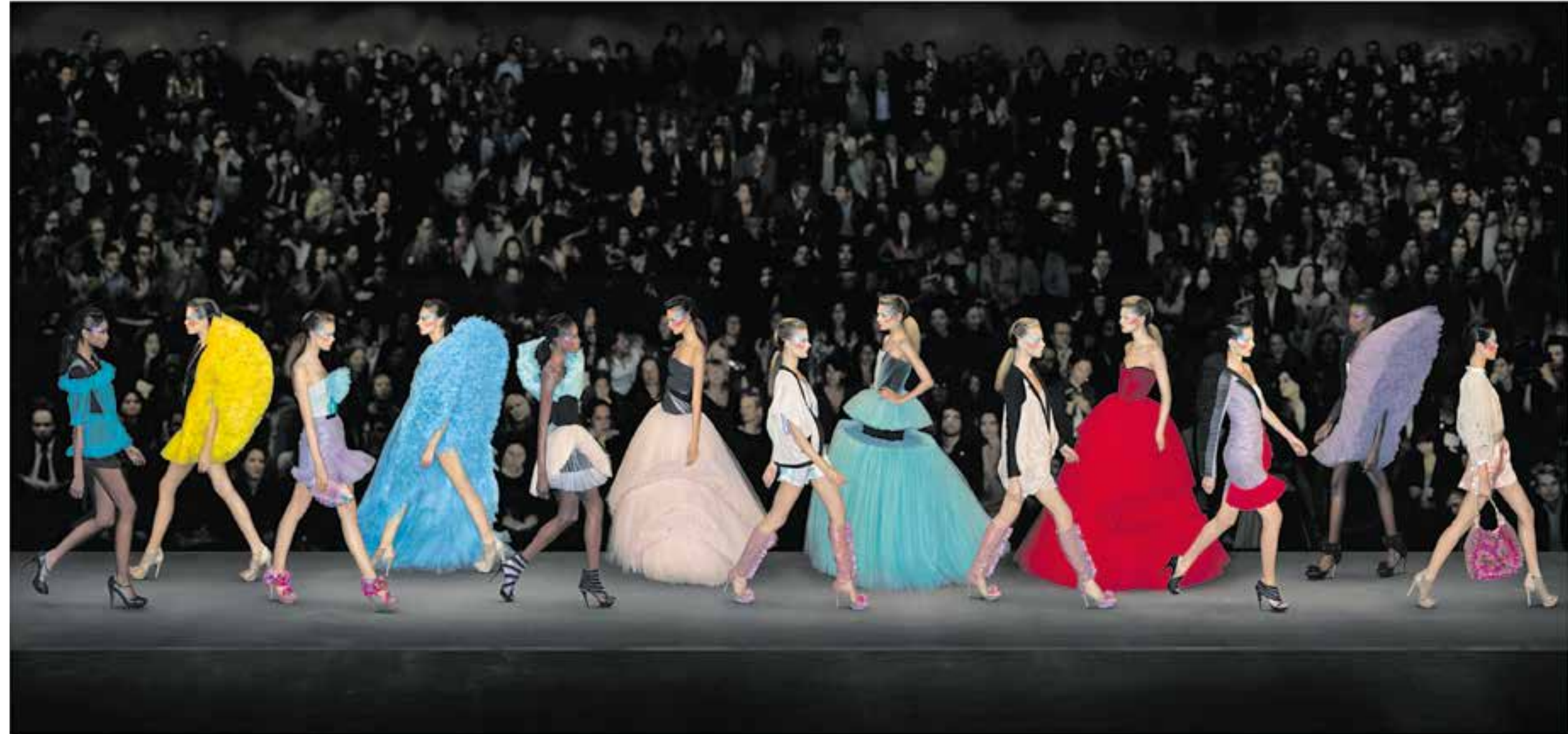
Andreas Gursky, V&R, 2011: Show Cutting Edge Couture, Ready-to-wear, S/S 2010