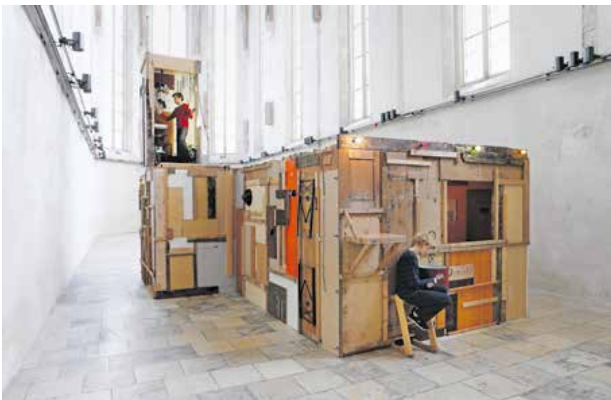
Alfredo Barsuglia, Der Junge, der die Welt nicht berührte , 2017, Galerie Zimmermann Kratochwill auf der Parallel Vienna

VON RIESENZWIEBELN, GLÜCKSBRUNNEN UND NIPPES