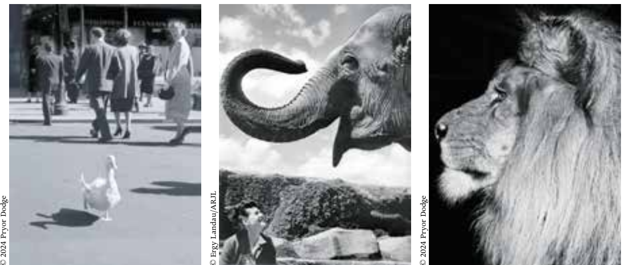
Ylla, Duck crossing 57th St. , ca. 1951, veröffentlicht in The Duck , 1952

Ylla. The Birth of Modern Animal Photography Von Pryor Dodge Text: Englisch 240 Seiten, 260 Abbildungen Hirmer Verlag € 49,90