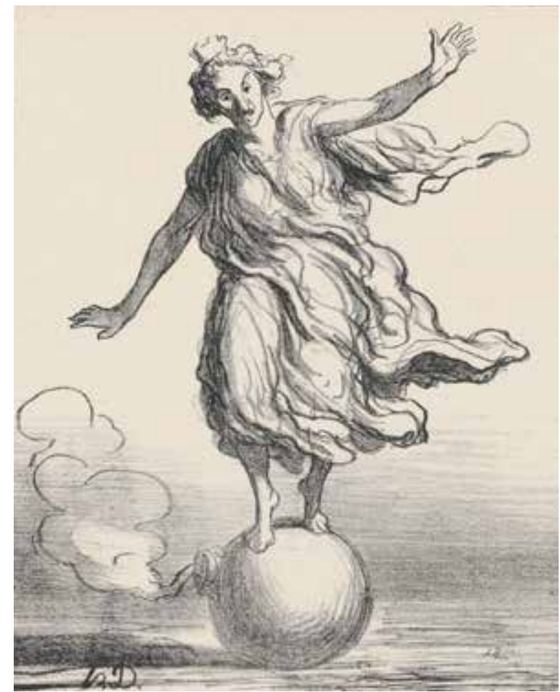
Honoré Daumier, Équilibre européen (Europäisches Gleichgewicht), 1867

Honoré Daumier Die Sammlung Hellwig Bis 12. Mai 2024 Städ. Museum, Frankfurt am Main Katalog zur Ausstellung Hirmer Verlag € 45,-